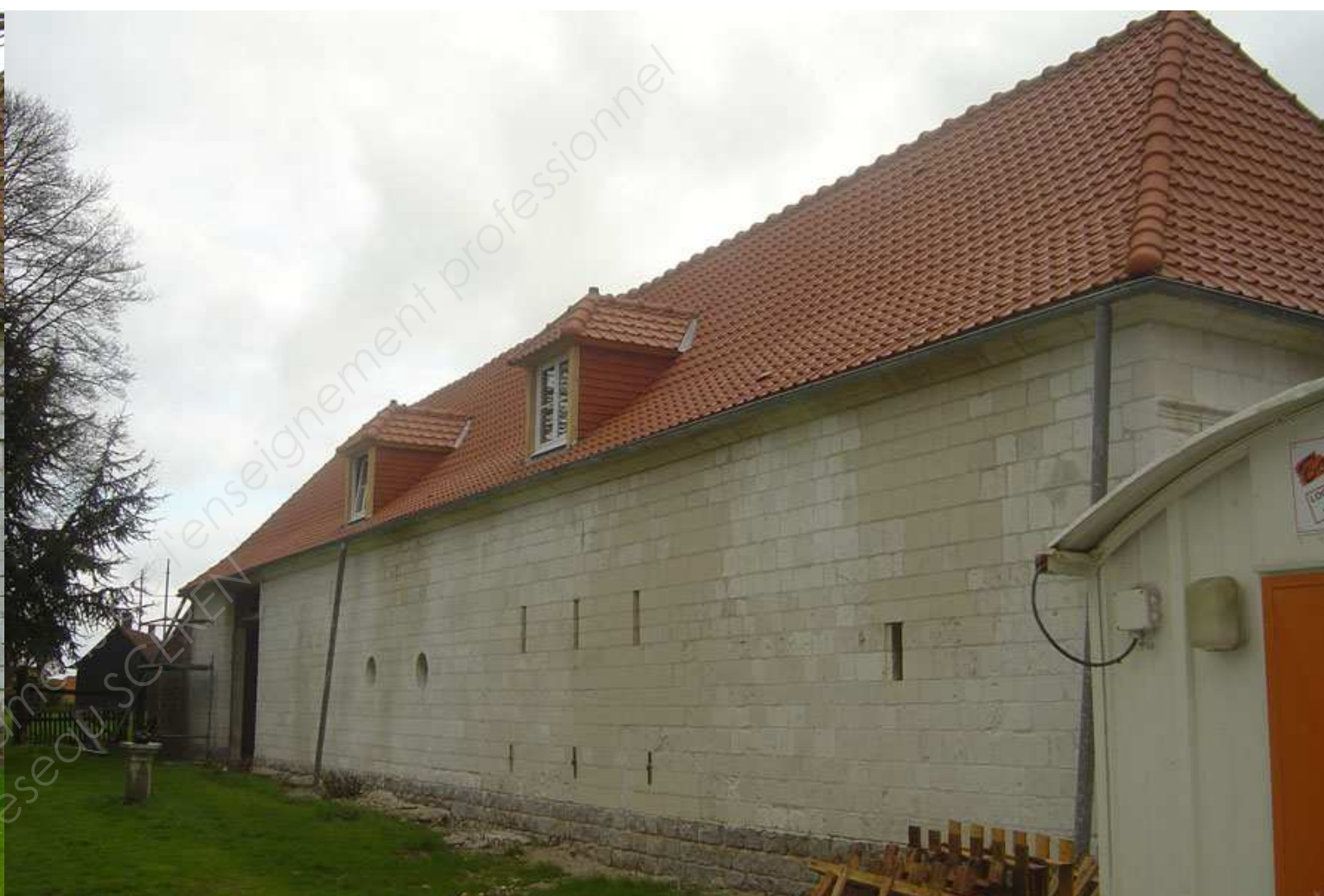
CHARPENTE / COUVERTURE (pendant travaux)