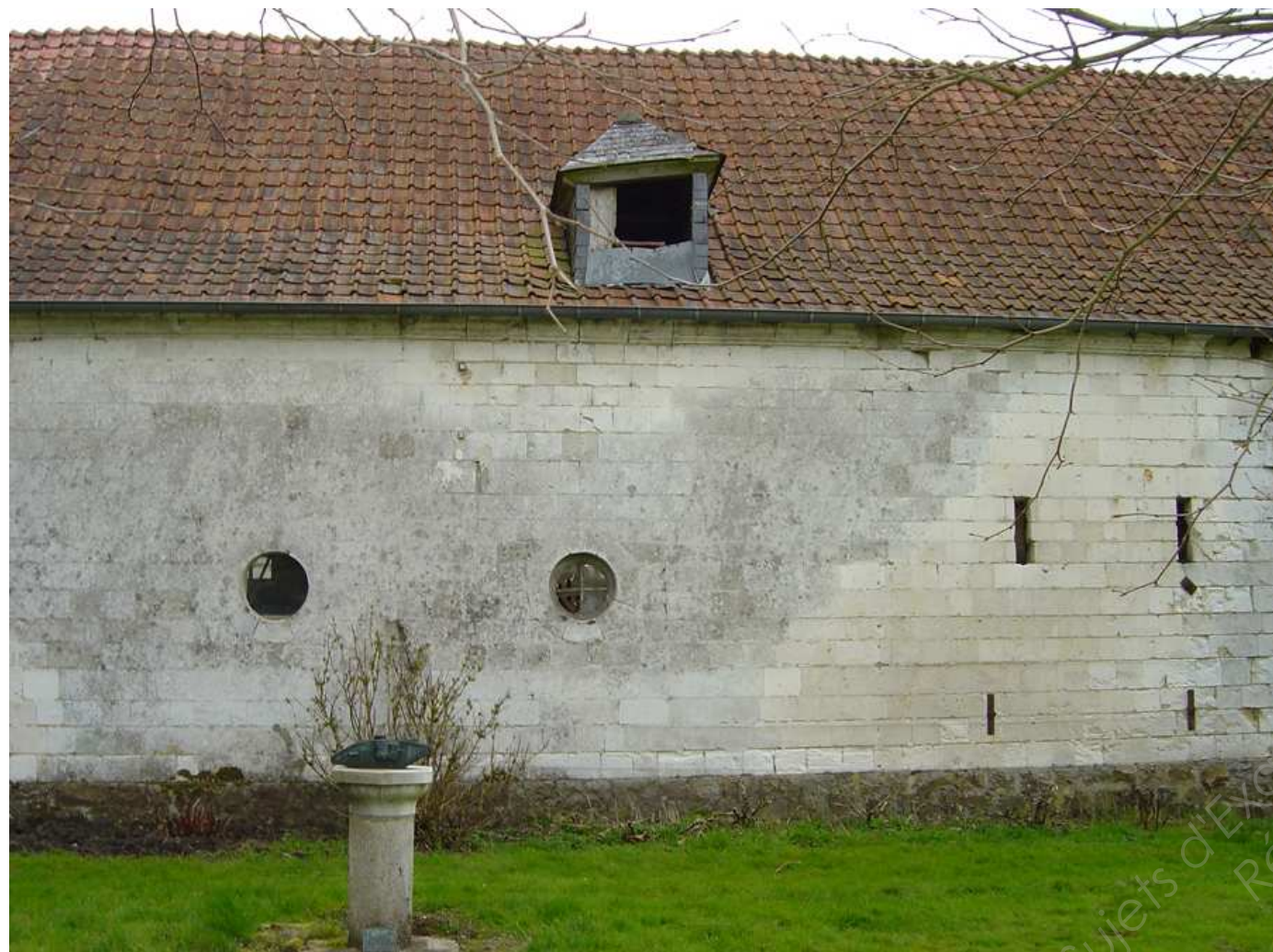
CHARPENTE / COUVERTURE (avant travaux)

Vous êtes sur un chantier de rénovation concernant la ferme du château de Bermicourt située dans le département du Pas de Calais. Pour les travaux d'aménagement en Hôtel Restaurant. « La cour Rémi », on vous demande d'intervenir sur certaines parties d'ouvrages.